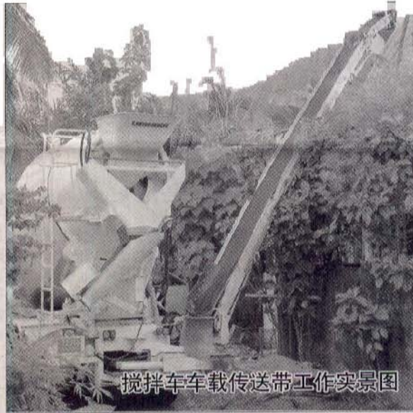
搅拌车车载传送带工作实景图